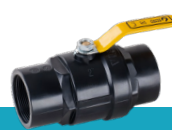
شیر توپی دو ضرب دسته فلزی با توپی آبکاری