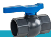
شیر توپی U-PVC چسبی