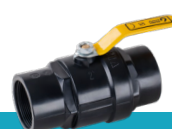
شیر توپی دو ضرب دسته فلزی با توپی بدون آبکاری