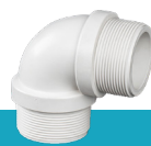
زانو نر رزوه‌ای U-PVC