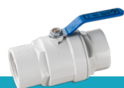
شیر توپی پرو وایت دسته فلزی با توپی بدون آبکاری