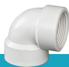
زانو ماده رزوه‌ای U-PVC