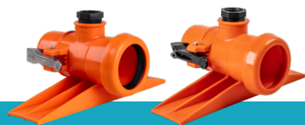
کد گروه محصول: ۴۳۱۷۳